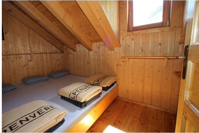
Fotka pro představu matraz lageru. Chaty jsou čisté a moc pěkné

První den budeme ubytováni na chatě Ursprungalm . Cena ubytování je cca 40€ se snídaní, večeri si vybíráte z jídelníčku. Spaní je zajištěno ve společné ložnici, kam potřebujete pouze vložku do spacáku (Například zde ). Další den pokračujeme na chatu Ignaz-Mattis-Hütte . Cena ubytování cca 40€ se snídaní.